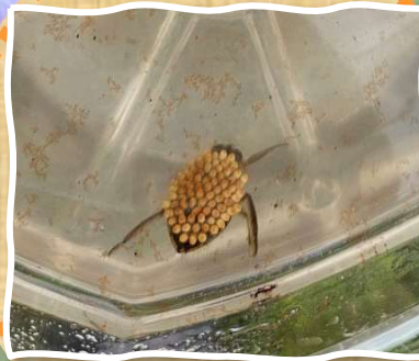
向新保町 ビオトープで

🍀「コオイムシ」がいた～ 🍀うれしい🍀 元いた場所へもどしたよ(希少な生き物です)