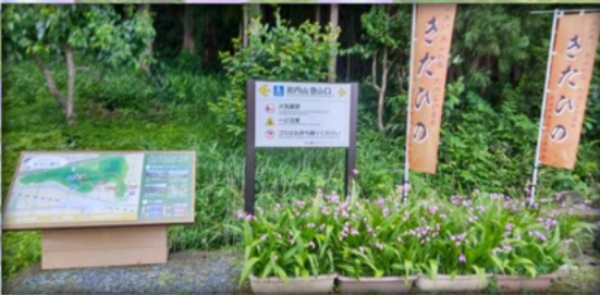
6/4 岩内山登山口を紫蘭の花でおもてなし 🌸