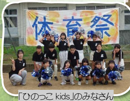
「ひのっこ kids」のみなさん