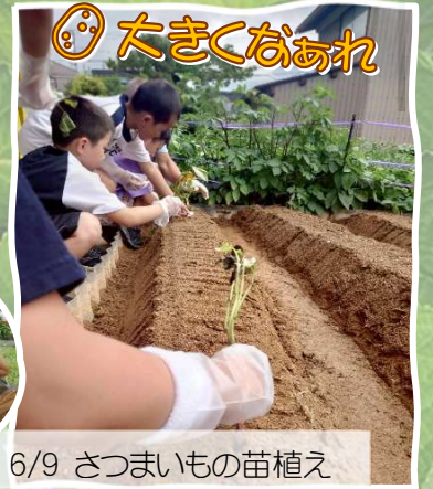
6/9 さつまいもの苗植え