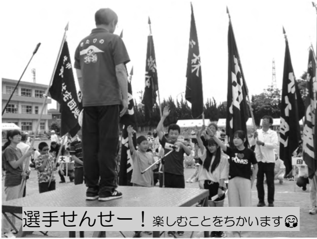
選手せんせい！楽しむことをちかいます😊