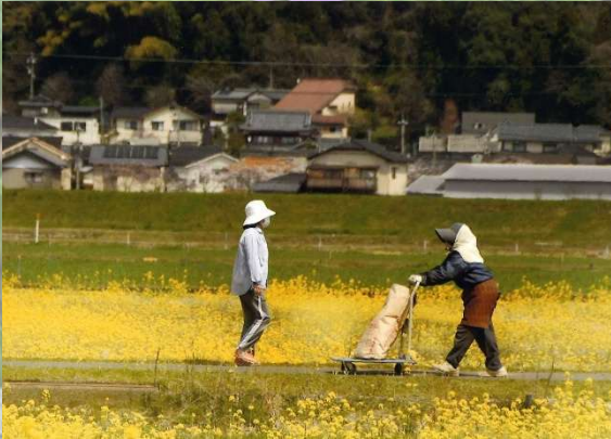
日野つオトクラブ