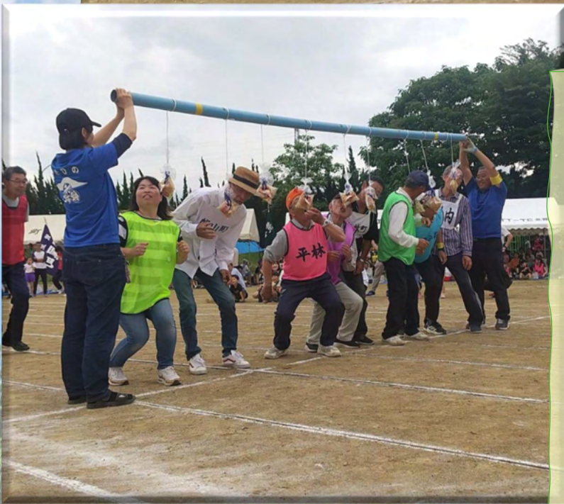
2026 年 6 月 7 日 地区体育祭