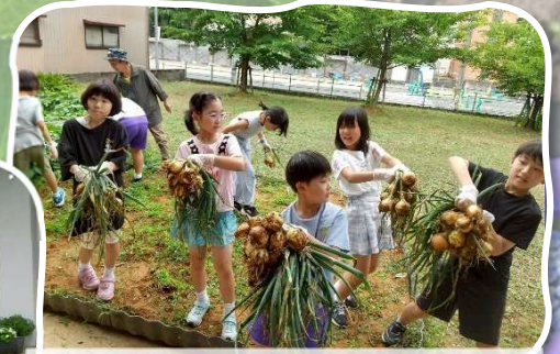
6/4 玉ねぎ♪いっぱいぬいて収穫～