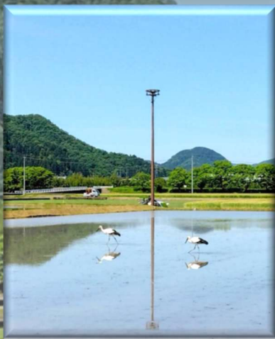
5/7 矢船町 巢塔 この春、ほぼ毎日の様にコウ トリペアが飛んできていまし た。ワクワク