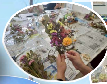
5/9 フラワーアレンジメント作り