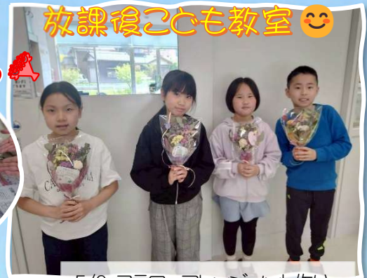
放課後こども教室