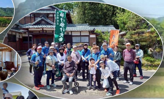
4/26 歩けあるけ 楽しかったね♪