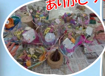
お母さん ありがとう