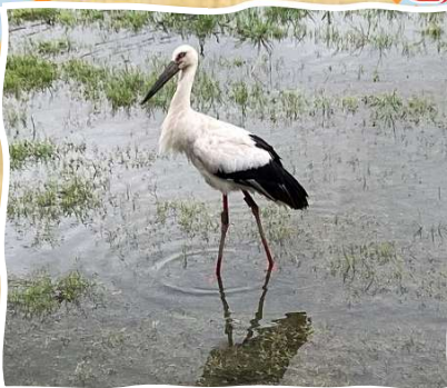
朝ごはん食べながら窓の外を見たら 目の前に2羽いてビックリ! 矢放町 4月21日