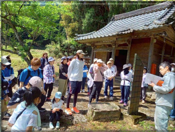
4月26日 健康ウォーク『歩け歩け大会』

夢楽洞万司絵馬に寄せて 北田野地区絵馬調査のなかで、一段と彩色を放ち躍動感あふれる絵馬に出会いました▼「夢楽洞万司」江戸後期から明治、大正期にかけて約五十年間、五代にわたる福井城下で「万司」の号を受け継ぎ絵馬や天神画を描きつづけた絵馬工房です▼初代は万司仙人を名乗り、雑俳の選者として活躍、庶民の日常や世相などを風刺し、ユーモアを狙った句は遊戯的なもので、万司仙人自らが生涯追い求めた「この世のすべては、つかの間の夢であり、どうせ夢なら楽しんで方がよい」と、民衆の厭世（えんせい）的な考え、無常観を乗り越える手段として楽天主義を積極的に説き、現世の夢を楽しむ技を売り物として、「夢楽」は、町人文化の全盛期と重なり多くの人のところをとらえ、民衆の輪を広げていきました▼そののち万司絵馬は門弟たちの奔走により各地の神社に奉納され、絵馬師としての万司仙人の名声はゆるぎないものとなり、今も越前だけでなく加賀、能登、越中地方にも多く残されています▼荒谷町日笠神社には、今から約三百年前の享保三年（一七一八）万司仙人雑俳興行より、約五、六十年以前すでに雑俳興行が行われていた句額が奉納されています。北田野地区の文化の高さに驚き、まだまだ目が離せません。