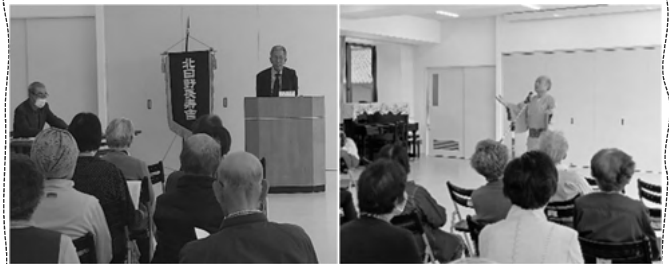
北日野シニアクラブ