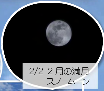
2/2 2月の満月 スノームーン