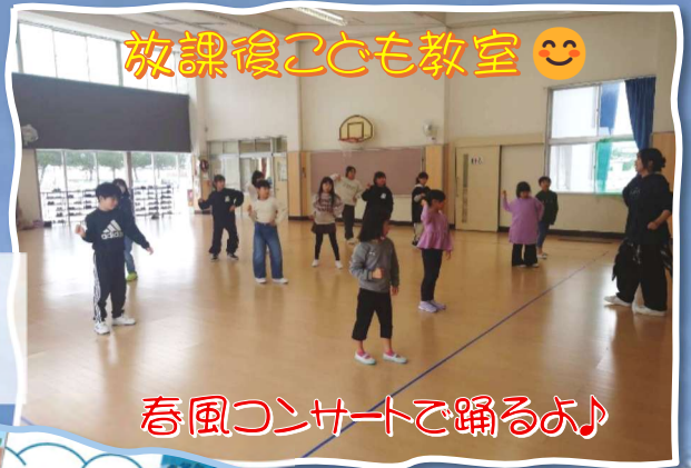
放課後こども教室 😊