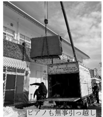
ピアノも無事引っ越し