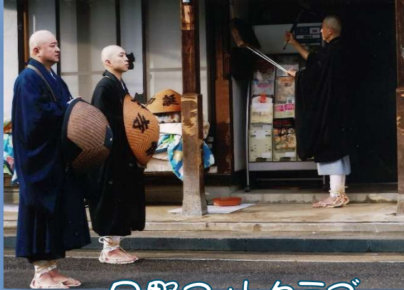
日野つオトクラブ