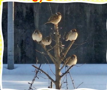
ふくらあおめ(向新保町)

自宅の軒下に毎日ひこばえを食べに来てい ます。うちの子みたいな存在で可愛いです♡