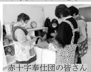
赤十字奉仕団の皆さん