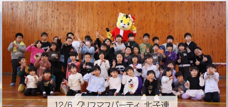
12/6 クリスマスパーティ 北子連

11/15 《北日野学びっ子 フェス》3 年生の皆さん が北日野公民館のことを 発表してくれました。