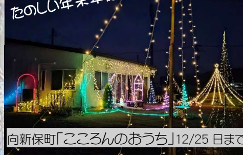
向新保町「こころんのおうち」12/25 日まで