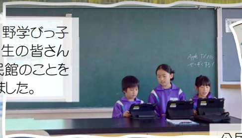
公民館冬まつり企画

11/15 《北日野学びっ子 フェス》3 年生の皆さん が北日野公民館のことを 発表してくれました。