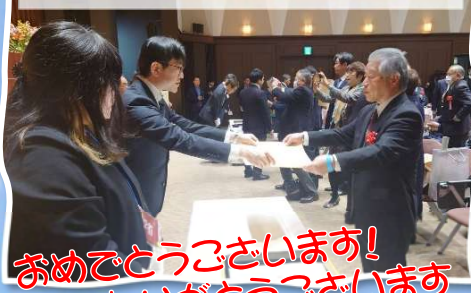
2月28日 優良公民館表彰式