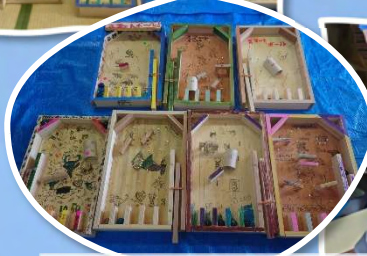
3/9 スマートボールづくり