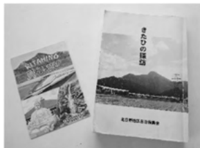
きたひの探訪 見どころマップ作成