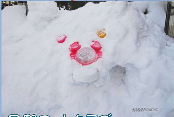
日野フットクラブ