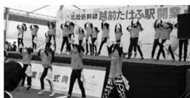
越前たけふ駅開業イベントでの 「ウェルカムダンス」披露