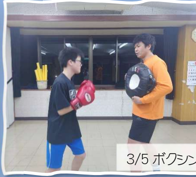
3/5 ボクシング体験教室