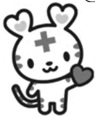
日本赤十字社 マスコットキャラクター ハートラちゃん