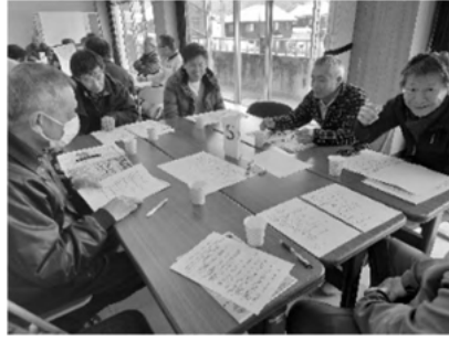
ご協力ありがとうございました

今後、これらの意見を参考に、理事会・企画委員会等で討議を重ね、「きたひのまつり」を企画していきたいと思えます。