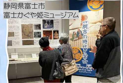
静岡県富士市 富士かぐや姫ミュージアム