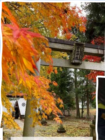
12/1 西尾町 「しめ縄づくり」 来年も良い年にな りますように