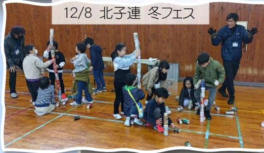
12/8 北子連 冬フェス