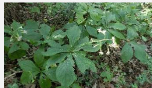
クルマバハグマ(9 月)