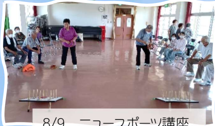
8/9 ニュースポーツ講座 北新庄と、輪投げで交流