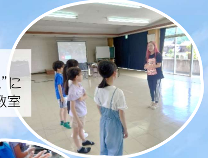
8/20 “さくらいと”によるダンス教室