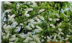
ウワミズザクラ(4 月)