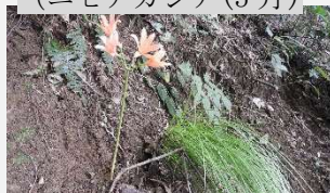
キツネノカミソリ(8 月)