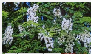
ハリエンジュ (ニセアカシア)(5 月)