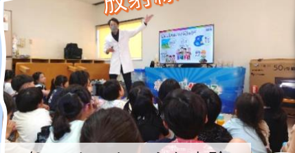
7/27 あっとうほうむ実験