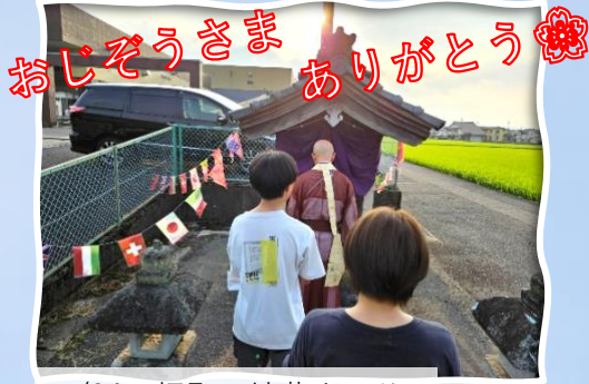
7/24 畑町 地蔵まつり