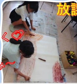
7/26 きたひのまつり看板作り