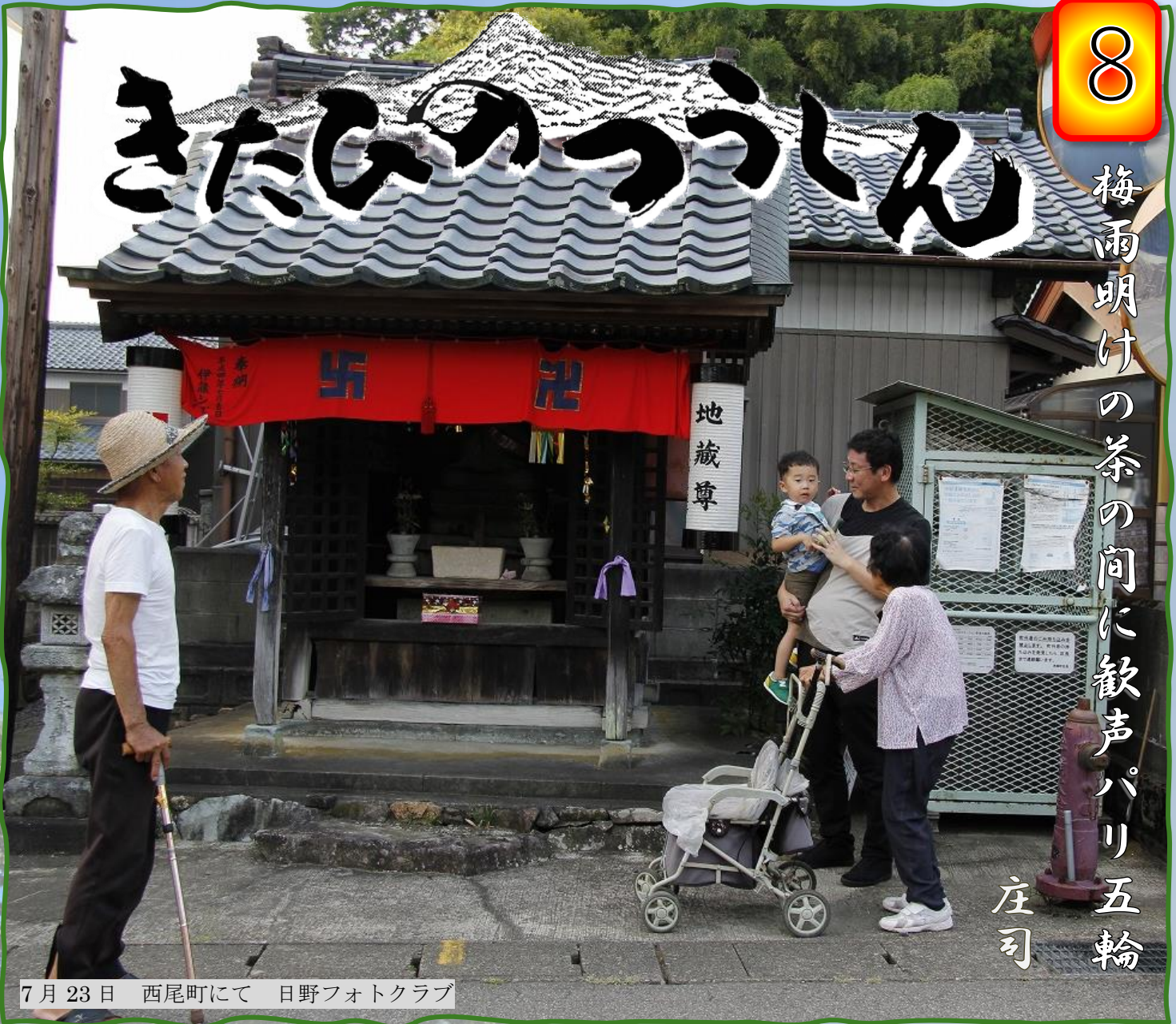
7月23日 西尾町にて 日野フォトクラブ