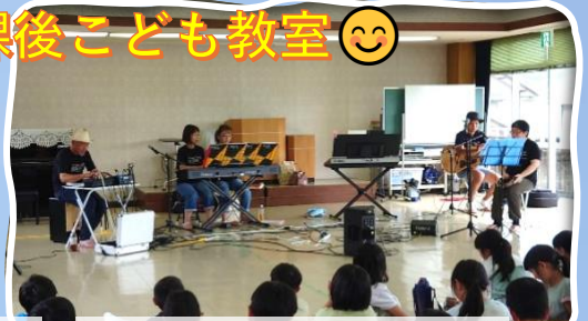
7/25 コナウイング演奏会