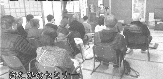
きたひのセミナー 北日野公民館和室にて、春の落語会を開催しました。