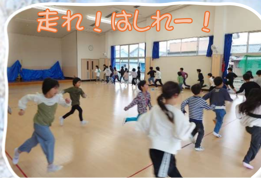
4/4 走るって楽しいね、早くなったよ! 「放課後子ども教室・走り方教室」