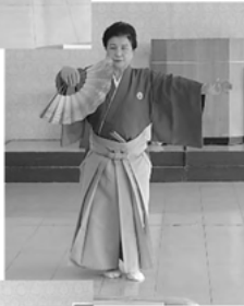
和歌 田子の浦ゆ 母の風雪