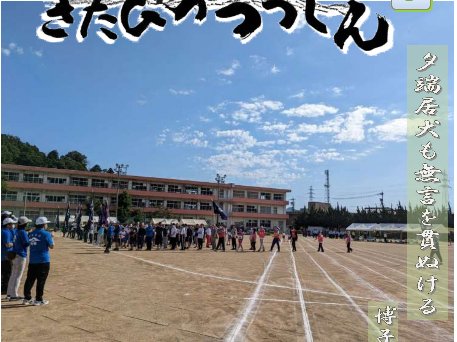
北日野地区体育祭 北日野小学校

子どものころに歩いた道、遊んだ川が「なつかしい」と感じる年齢となった。残念なことにそれらのほとんどが今はなくなってしまったが、はるか昔の楽しい思い出は、学校からの帰り道の山や川、田んぼで遊んだことだった。