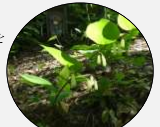
ミヤマナルコユリ

花がたれ下がってつく様子を田んぼの鳴子に見立てて名がついた。よく似たミヤマナルコユリは茎に角があり葉が卵形で広い。深山というが低山でよく見られる。