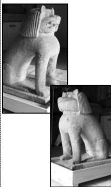
石製 50cm 高さ 40 重量