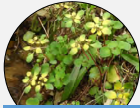
ホクリクネコノメソウ

よく似たネコノメソウは横に這って広がり葉は対生する。これらより大きく葉が厚く苞(ほう)が黄色が目立つのはホクリクネコノメソウである。