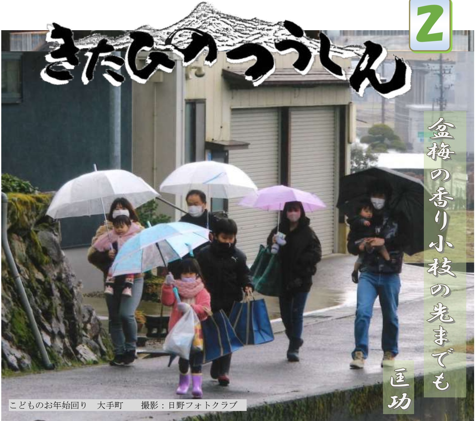
こどものお年始回り 大手町

雪のない正月！畑の片隅でふきのとうを六つ見つけた。早速持ち帰り妻にふきのとう味噌を作ってもらい昼食と一緒に食べた。『ほろ苦き中に味ありふきのとう！美味しいね！』