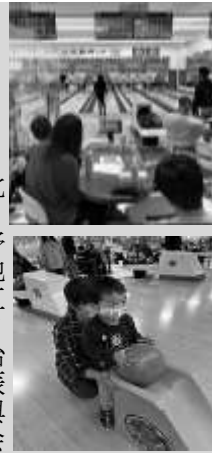
北日野地区自治振興会