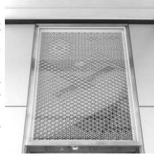
越前指物をデザインした壁面

駅の工事はほぼ終わっており、鉄道・運輸機構の方から、外観は西側も東側も同じで、コウノトリをイメージしていること、内部壁面などに、越前の伝統文化を取り入れていることなどの説明を受け構内を見学しました。ホームの安全柵には地元の景勝地や特産などの写真が飾られ、窓に切り取られた岩内山の紅葉がとてもきれいに見えました。