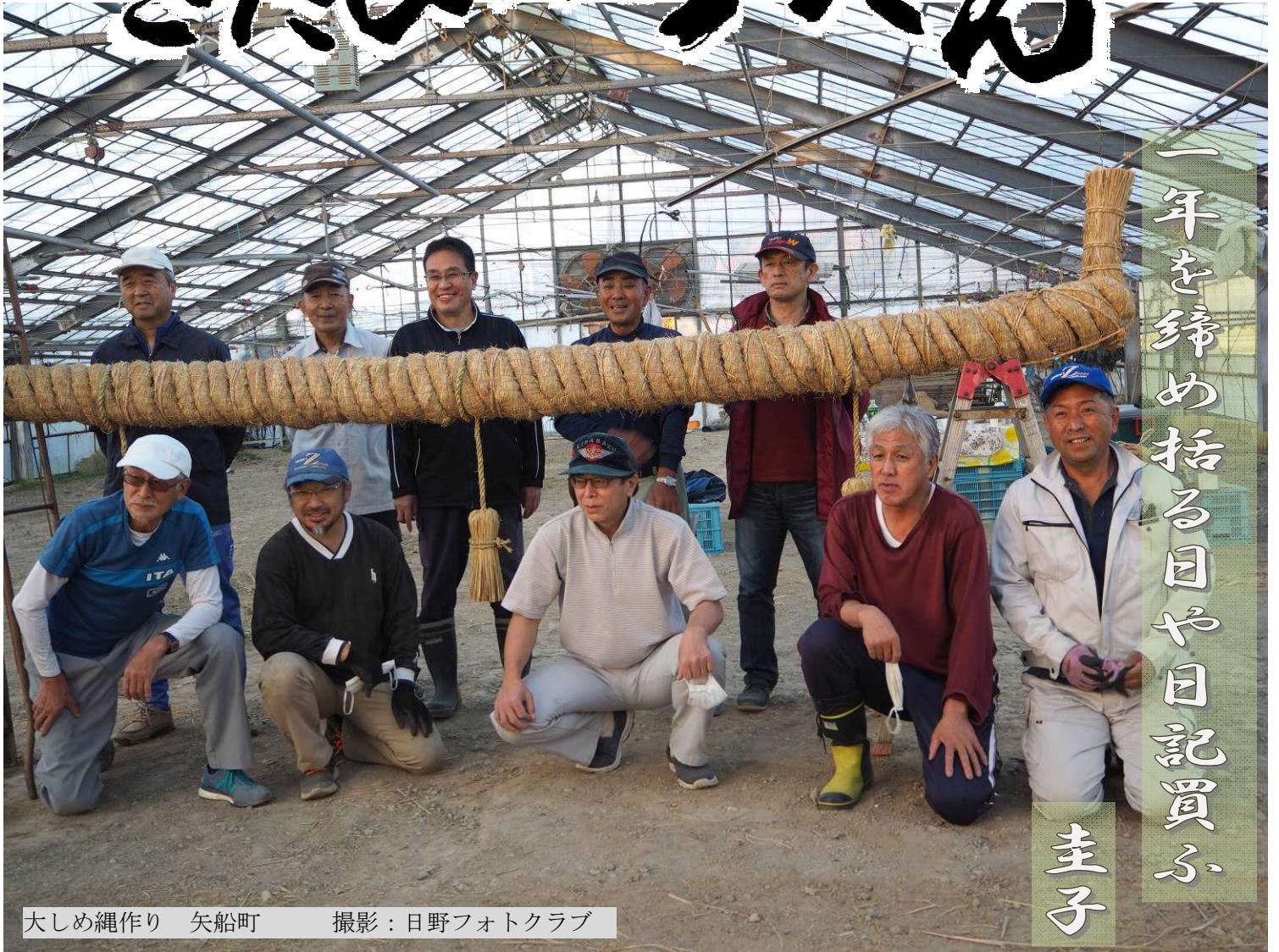
大しめ縄作り 矢船町