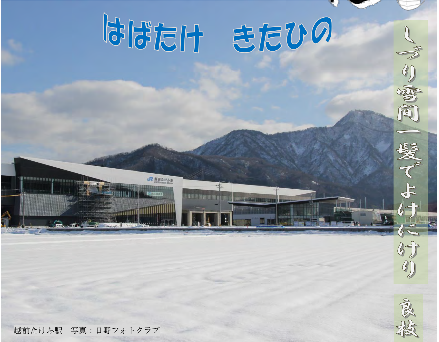
越前たけふ駅