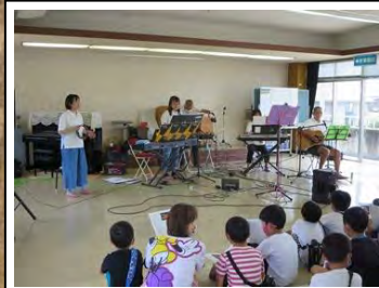
7/27 ミニコンサート【コナウイング】