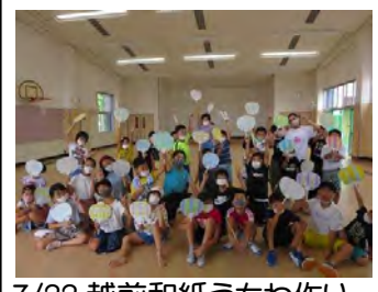
7/22 越前和紙うちわ作り & マジックショー