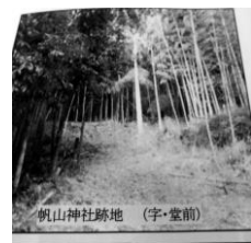
帆山神社跡地 (字・堂前)

帆山神社 賀茂大明神と名乗る「南越温故集」には、帆山賀茂大明神 今立郡二在。延喜式二帆山ノ神社ト云 帆山・矢放・大屋三ヶ村之産土神之由」とある。帆山神社は、日野川の洪水を防御するために、山城国(京都)上賀茂神社の分霊で、「賀茂別雷命」を治水の神、農業の神として勧請。神紋は賀茂神社系の「双葉葵」が用いられています。別雷命は、元来、雷神、火神で、古代には人々は自然を敬うとともに、「雷」「火」は、恐れでもありました。また、雷をも支配する強大な力が必勝につながるとして、勝運と武運長久を願う武将が篤く信仰していました。「帆山神社」は、元々帆山村の東南字・堂前地籍に鎮座していたもので、旧帆山神社参道には当時を偲ぶ石柱が残されています。