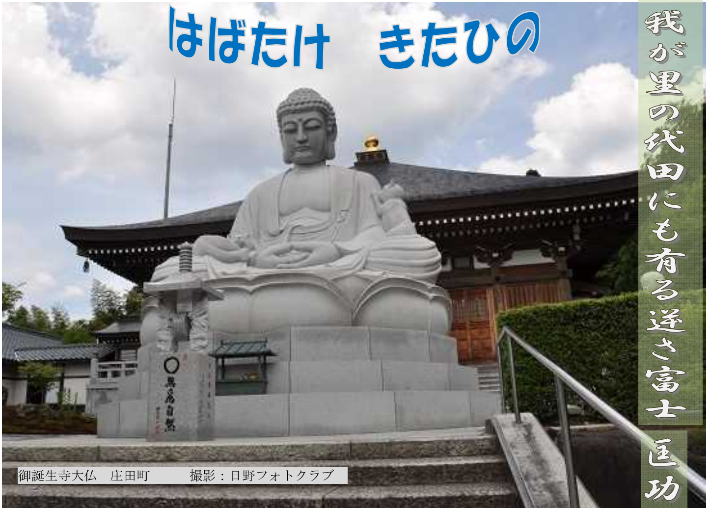
御誕生寺大仏 庄田町