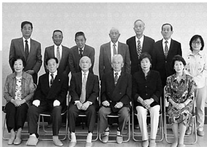
『きたひの探訪』編集の皆さん

新型コロナウイルスの影響で中止・延期になることも多いかと思えます。随時紙面にてお伝えしていきます。