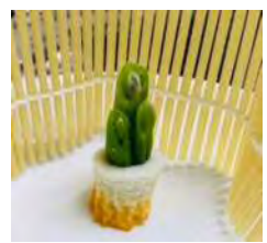
Y・N 氏作 ちくわ・いんげん門松