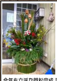
今年も立派な門松完成!