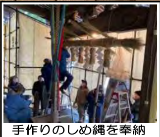
手作りのしめ縄を奉納