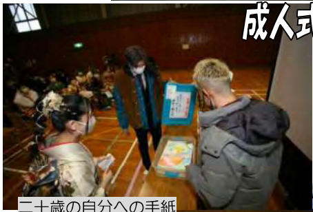
二十歳の自分への手紙