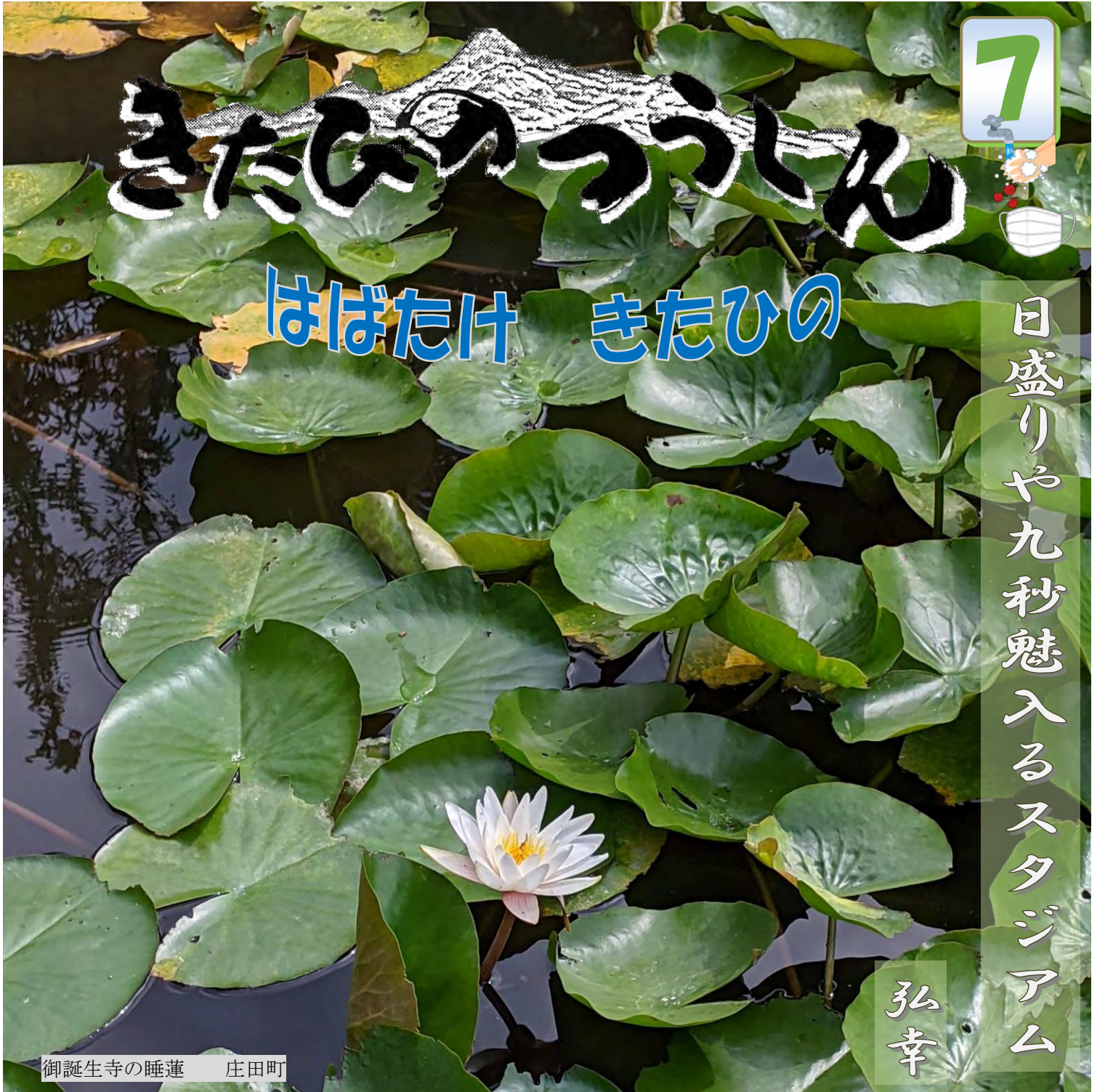
御誕生寺の睡蓮 庄田町