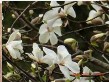
≪コブシ(モクレン科)≫