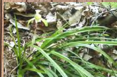
≪シユンラン (ラン科)≫

尾根道の脇など乾燥ぎみの所に生えている草丈20cmほどの多年草。葉はかたく巾2cmほどの線形で扇状に出て先はたれる。暗緑色でへりはざらつく。葉の間から20cmほどの花茎を出し、うす黄緑色の花を1こ横向きにつける。花びらは白く濃い赤紫色の斑点があり前方にまがる。この斑点をホクロに見立ててホクロともいう。花の色と形に変異があり園芸品として人気がある。