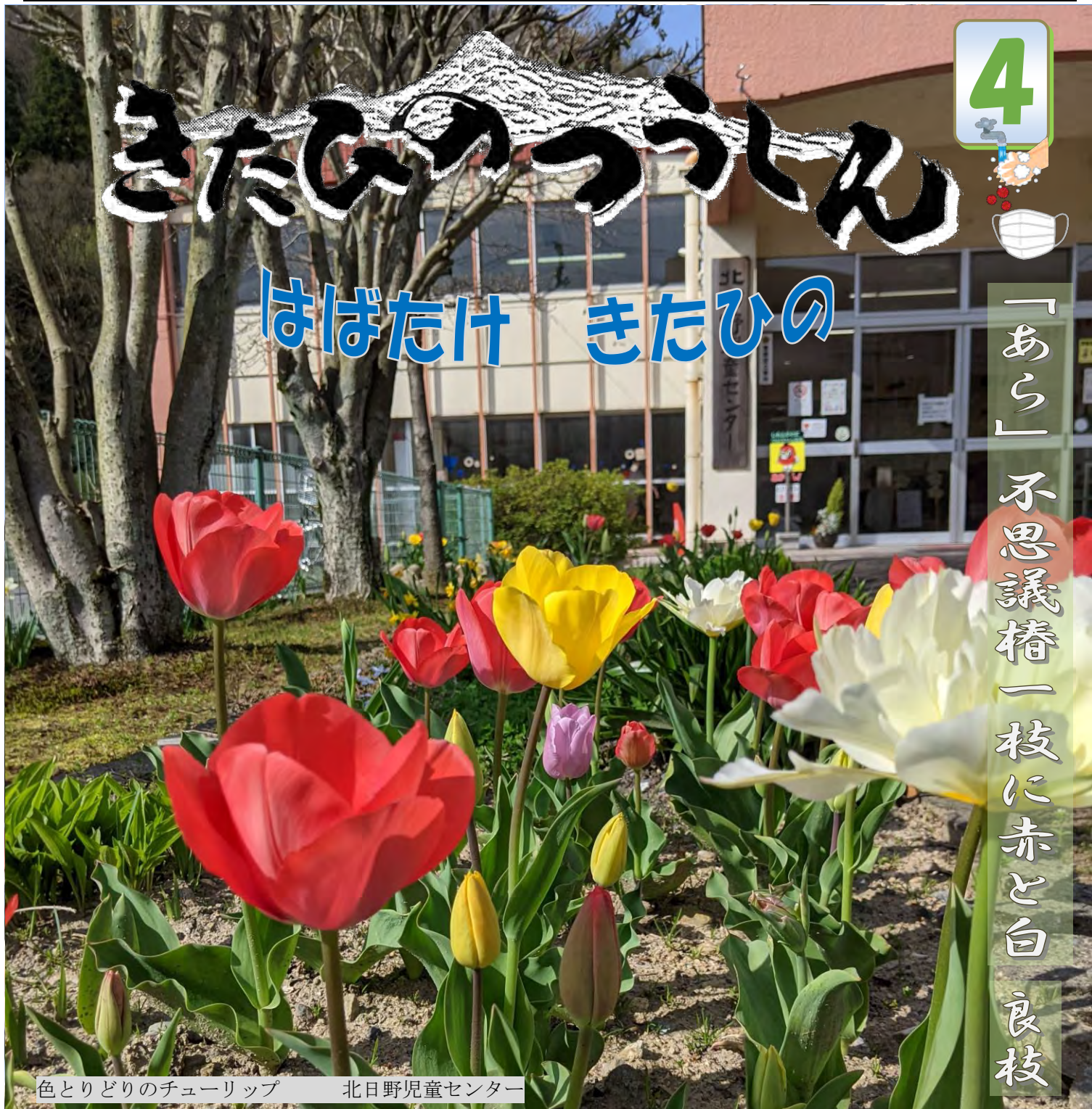
色とりどりのチューリップ 北日野児童センター

新型コロナウイルスの脅威が益々増してきている中、連日、外出自粛が叫ばれています。そんな中東京オリンピックの聖火リレーがスタートしましたが、何とも煮え切らない複雑な気分ですネ。 「外出の自粛」飲食業の「営業時間短縮要請」など誰も彼も大変です。 都会じゃ多くの若者がストレスを抱かえているのだとか。深夜になっても屋外に繰り出し飲酒して大騒ぎしている姿が連日、テレビに映し出されています。何をしてもってそこまでして酒を飲みたいんだ？ 「お前ら何か他に楽しみはないのか！」そんなにしてまで酒が飲みたいのなら一升瓶でもビール瓶でも持って山へ籠れ！ 「人ごみ」は「人ゴミ」ともいう。多くの人がいる中で目立ちたいのでしょうか。 一人の時間を楽しく過ごす方法をそれぞれで考えられないのかなア？ コロナウイルスは命に係わる非常事態だ。後期高齢者世代のド真ん中にある私にや。 「ストレス」なんて感じたことなど一度もありやしない。「外出自粛」なんて今に始まった事じゃなく毎日のこと。これを「出無精」という者もいるが、確かにそうかも知れない。歳を重ねると他人を「斜め見るクセ」が付き、またそれは私にとってのコロナに感染しない安全なストレス解消法かな？ 最後に飲食業を初め全サービス業の人たちの奮闘を祈念します。ガンバレ！