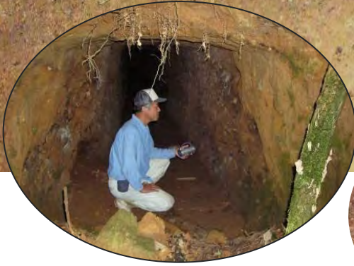
平林町の巨大な防空壕