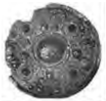
飛禽文鏡(イメージ)

大きな一号墳から中国からの伝来品である飛禽文鏡(ひきんぶんきょう)が出土したのは驚きです。